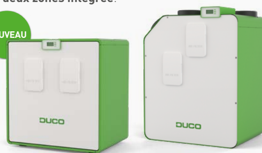
DucoBox Energy Comfort Plus